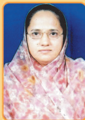
राजमाता कृष्णकुमारी देवी